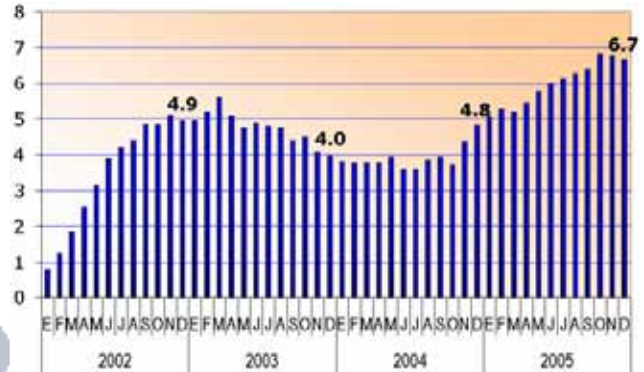
Producto Bruto Interno Global (Variaciones Porcentuales Anualizadas)

Consideramos que el crecimiento registrado está sustentado en el desempeño positivo de todos los sectores económicos.